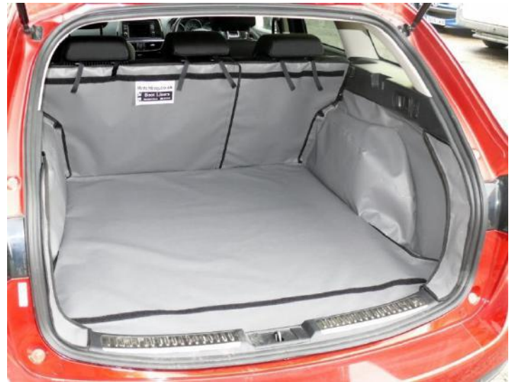
Bild zeigt geteilter Rücksitz, vorbereitet für Stoßstangenschutz und Sitzschoner